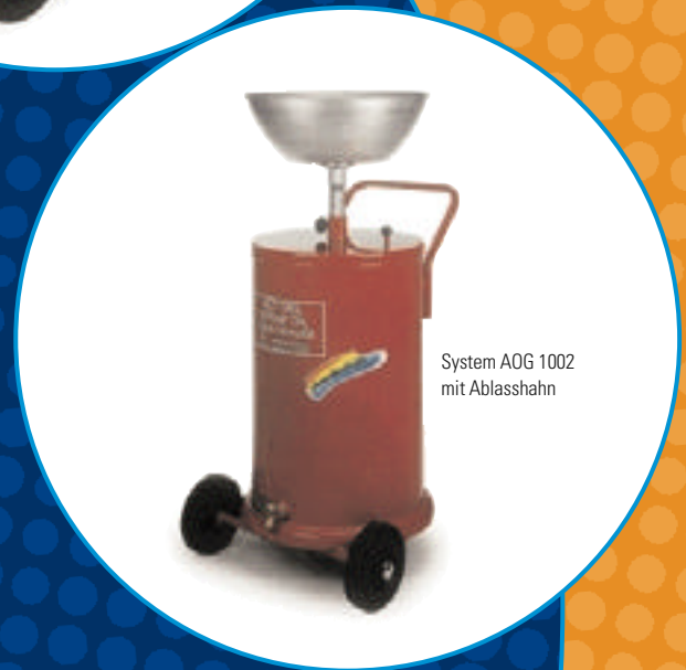
System AOG 1002 mit Ablasshahn