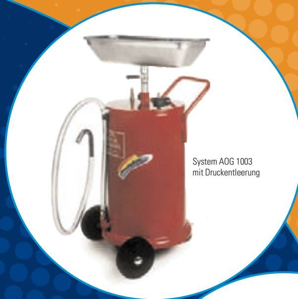
System AOG 1003 mit Druckentleerung

Die kompletten mobilen Systeme zum sauberen Auffangen, sicheren Zwischenlagern und endgültigen Entsorgung.