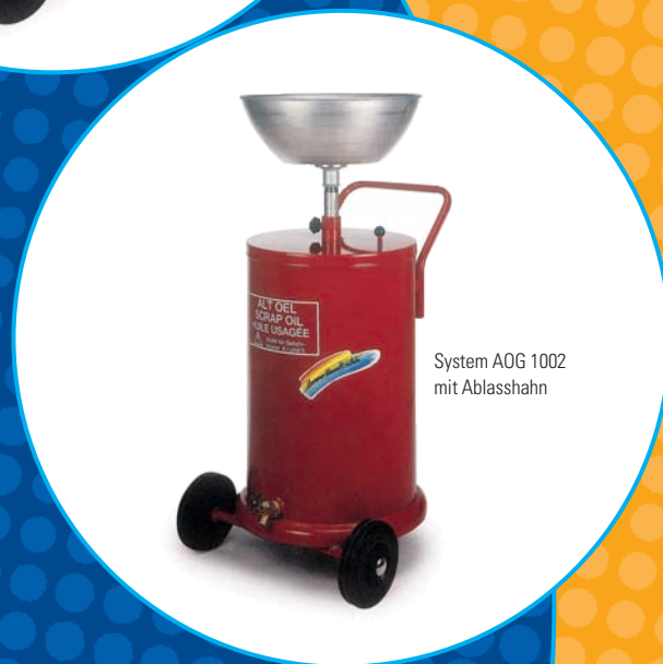
System AOG 1002 mit Ablasshahn