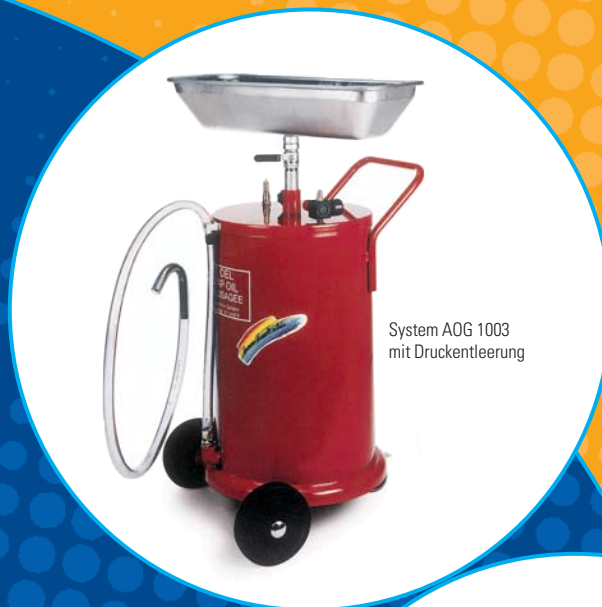
System AOG 1003 mit Druckentleerung

Die kompletten mobilen Systeme zum sauberen Auffangen, sicheren Zwischenlagern und endgültigen Entsorgung.